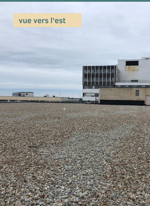
vue vers l'est