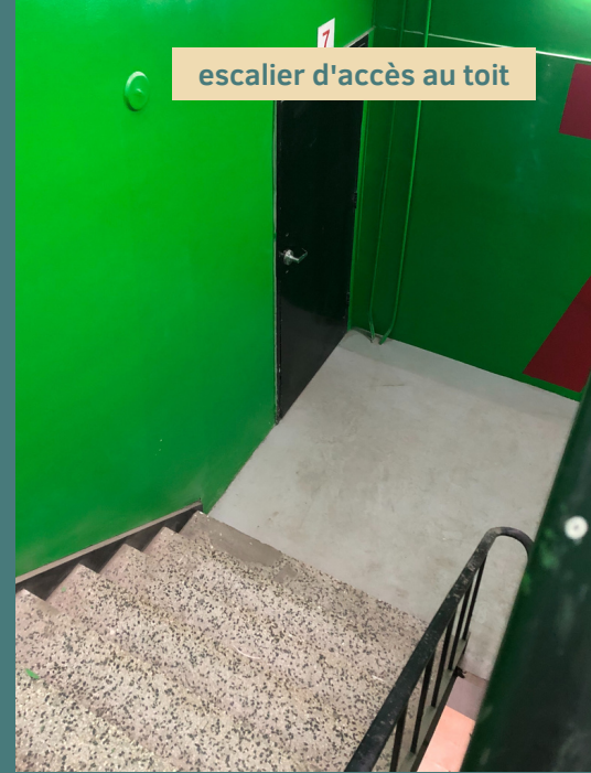
escalier d'accès au toit