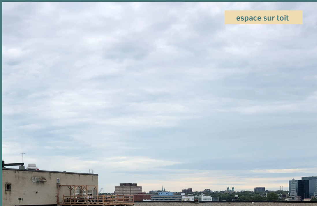
espace sur toit