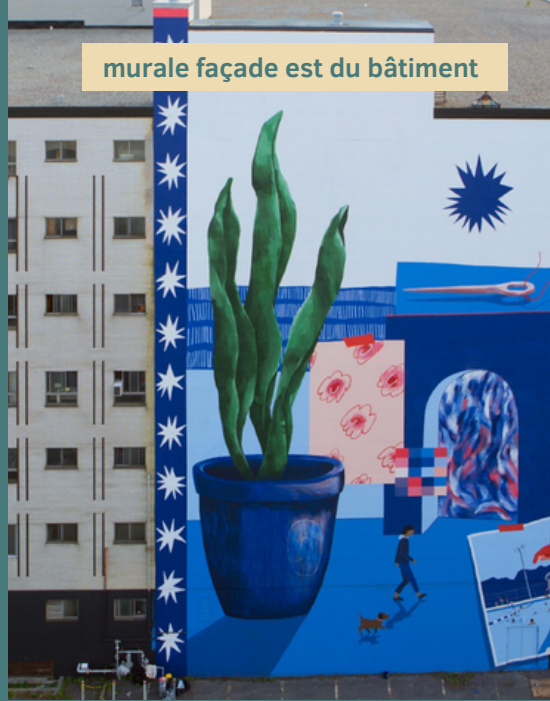
murale façade est du bâtiment