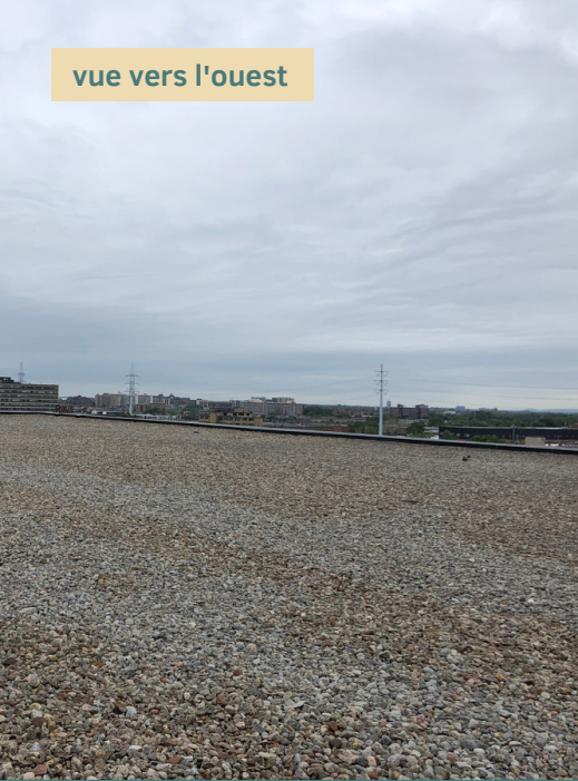
vue vers l'ouest